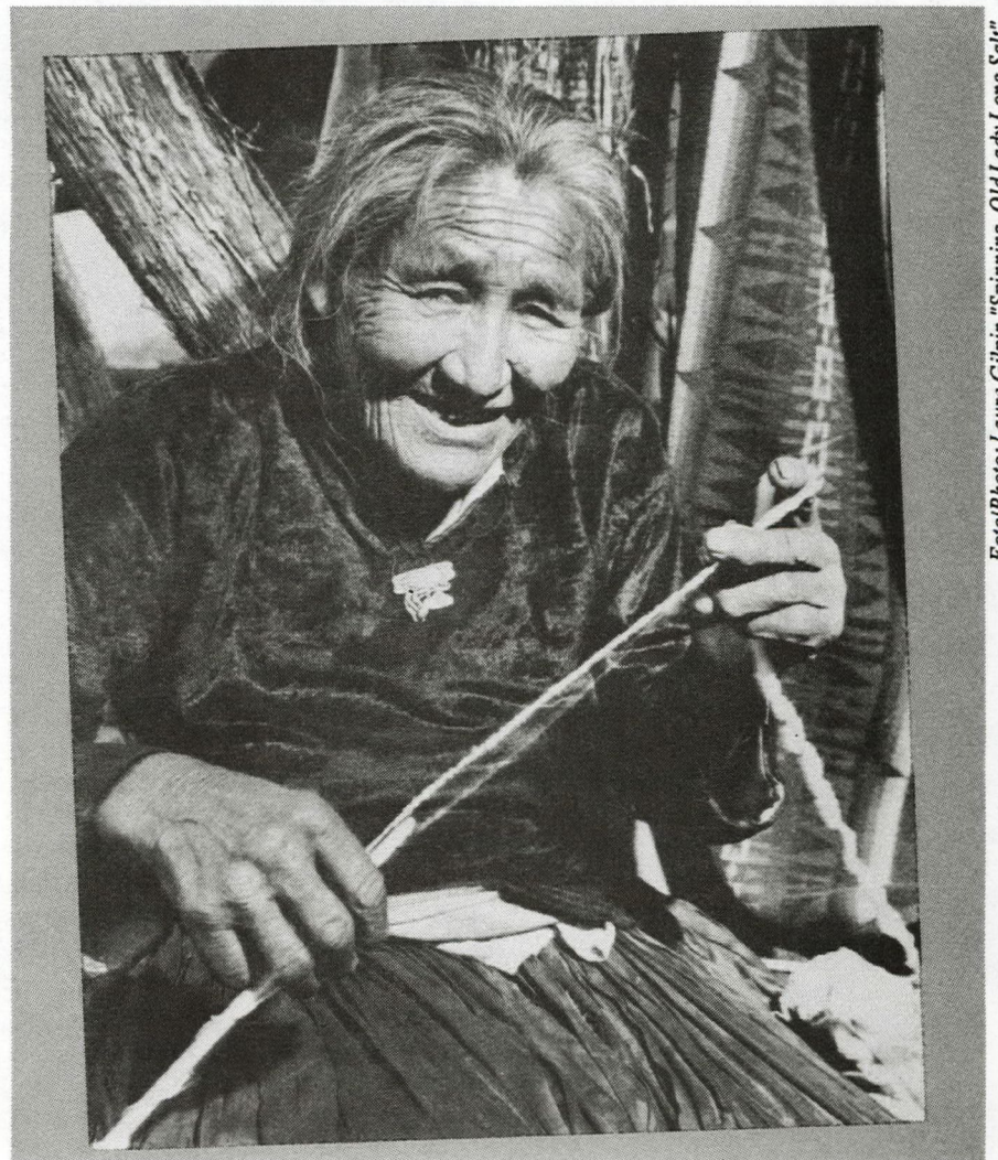
FotoPhoto: Laura Gilpin "Spinning. Old Lady Long Salt"

With all this, the answer to the question of what would seem to mobilize the testimonial tendency (this resorting to the oral tradition) is not yet clear. The problem of identity, of who we are, of what has happened to us, is still complex. Perhaps it is simply not enough to express that memory, that “word” of the marginalized and the dominated in a graphic form. Perhaps the key is in a fundamental reassessment of that which has constituted us all as subjects: the history of our mestizo being. We need to attempt to explain the distancing that we, as the “enlightened” elite, put between ourselves and that testimonial production that could account for who we really are 2 .