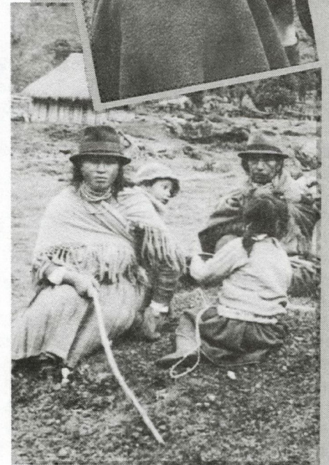
Fotos/Photos: Petrus Van, Ecuador Mujeres Saraguro/Saraguro Women Contemplando el palo encebado/At the "palo encebado" game Esperando la fiesta/Awaiting the fiesta