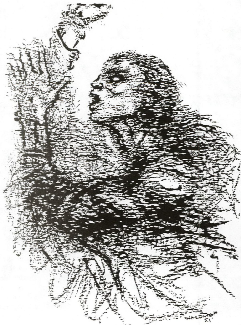
Drawing by Manushi, Lajpat Nagar, New Delhi

- The bench is mine - he says when he returns.