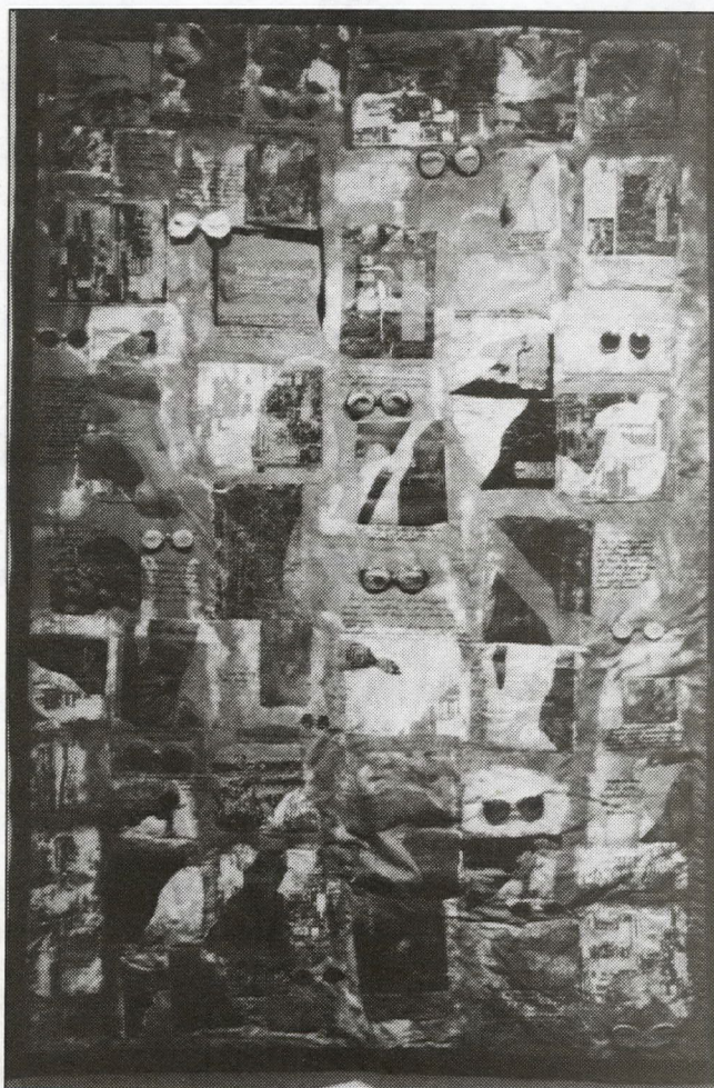
Cristina Gasc Observing a New Culture (Silkscreen) Observando una Cultura Nueva (Serigrafía)