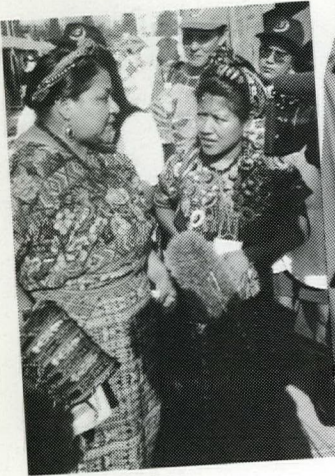
Mujeres indígenas presentes en Pekín, entre ellas Rigoberta Menchú, a la izquierda